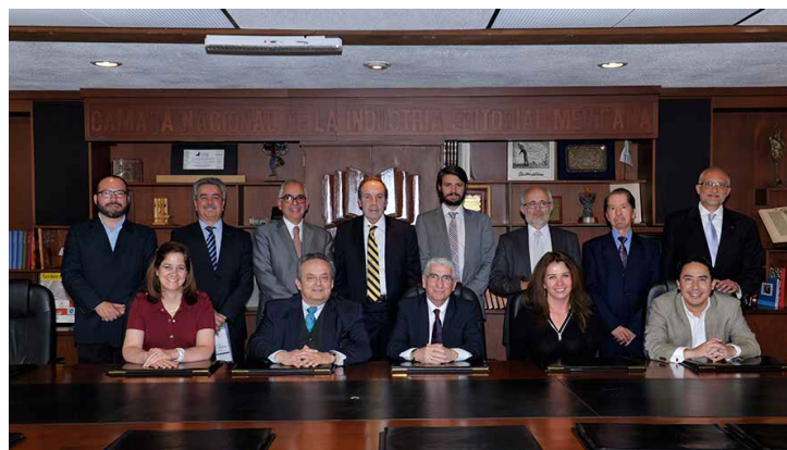
Consejo Directivo de la CANIEM.