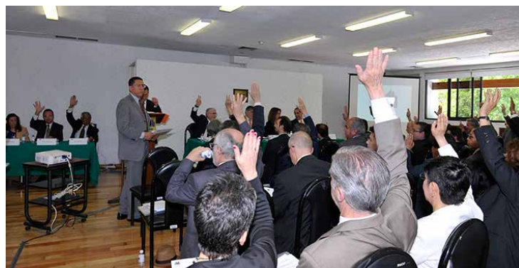
Votación de la LII Asamblea General Ordinaria.