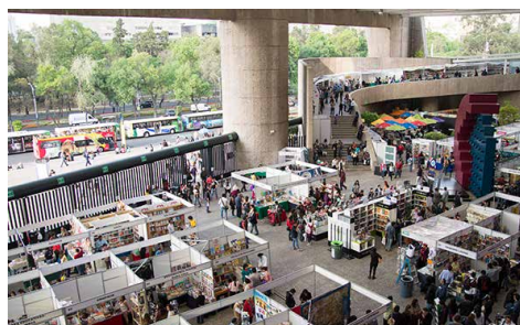
10° Gran Remate de Libros del Auditorio Nacional.

El Secretario de Cultura también recordó que en esta ocasión en el Remate se conmemorará a Miguel de Cervantes y William Shakespeare a 400 años de su muerte; a los escritores Elena Garro y Gonzalo Rojas en el centenario de su nacimiento, así como al poeta Rubén Darío, quien falleció hace un siglo, y a Umberto Eco, quien murió este año.